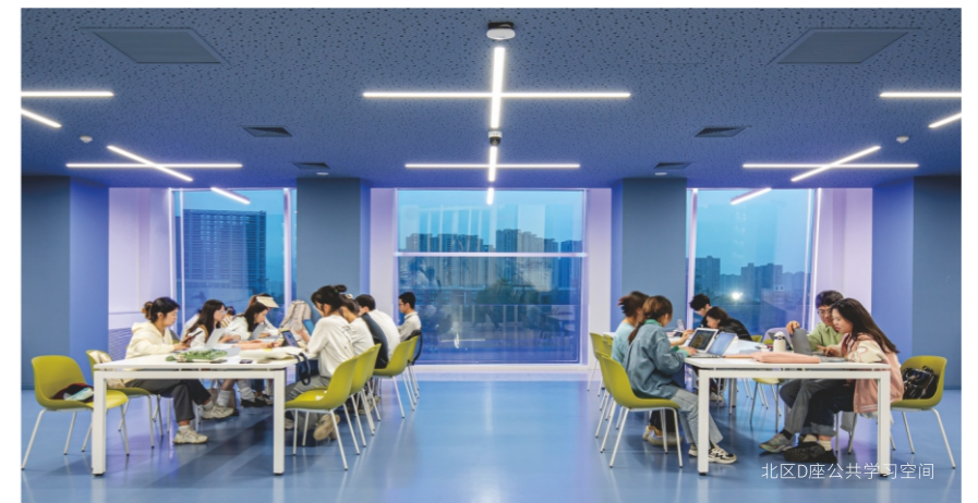
北区D座公共学习空间

如果你希望通过本升硕、出国游学让人生阅历变得更加丰厚,欧亚将为你提供学历提升的各种通道,设立考研自习室、通宵自习室,还开设考研辅导班、出国游学营等,为有意愿拓展学业生涯的同学提供便利的自习之地,使你的升学更有保障。