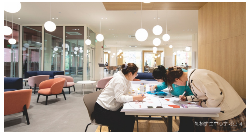
虹桥学生中心学习空间