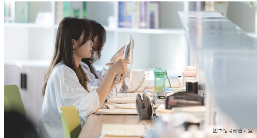
图书馆考研自习室